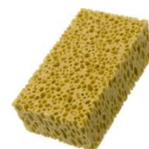
Губка натуральная морская или синтетическая